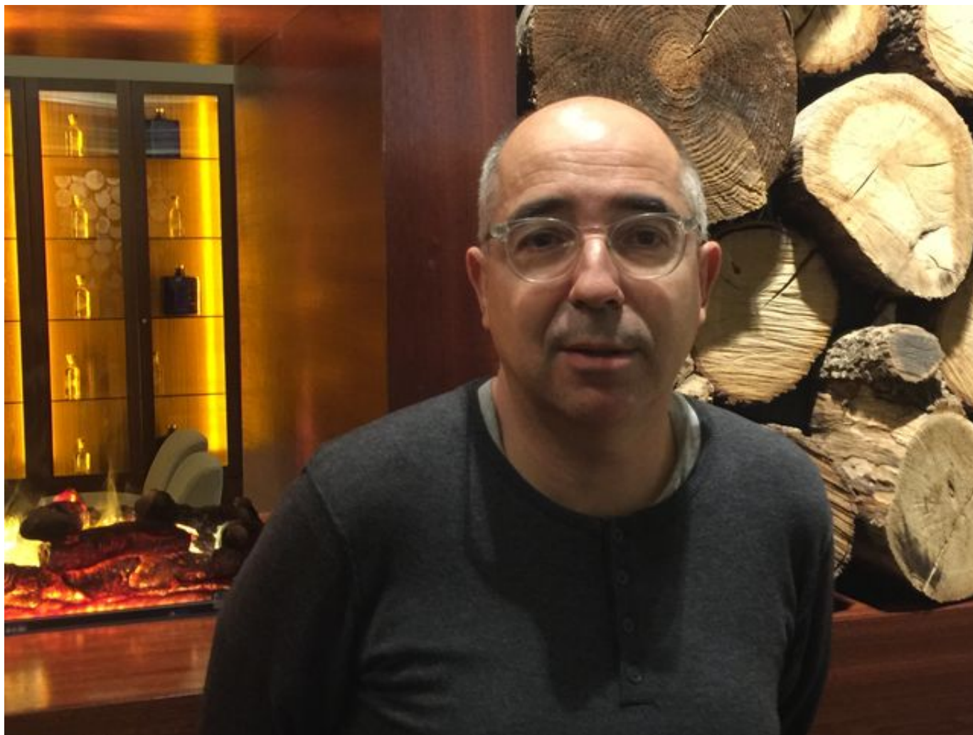
El escritor y profesor universitario Xavier Casals

El profesor universitario y escritor Xavier Casals (Barcelona, 1962) lleva muchos años investigando a la ultraderecha y la dictadura o los cambios que se están produciendo en Cataluña y el auge de los populismos (El oasis catalán (1975-2010): ¿Espejismo o realidad?). Acaba de publicar 'La Transición Española, el voto ignorado de las armas' (Editorial Pasado & Presente) con una tesis muy sugerente: las diferentes expresiones de violencia política en la Transición actuaron como un auténtico "partido armado" que influyó con fuerza en aquellos años en los que moría una dictadura y nacía una frágil democracia. La defendió en una charla en Bilbao, invitado por el Memorial de Víctimas del Terrorismo.