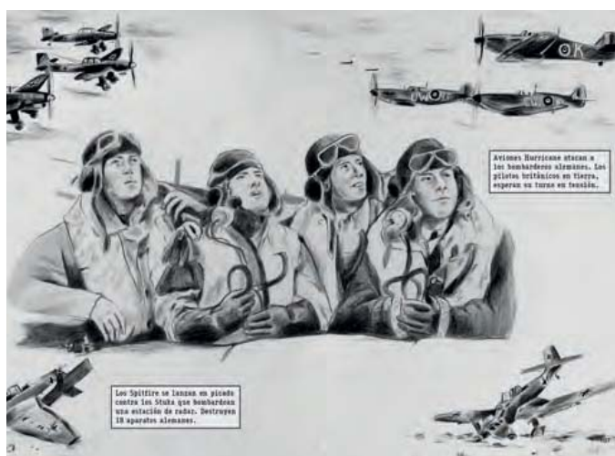
Pilotos de Spitfire