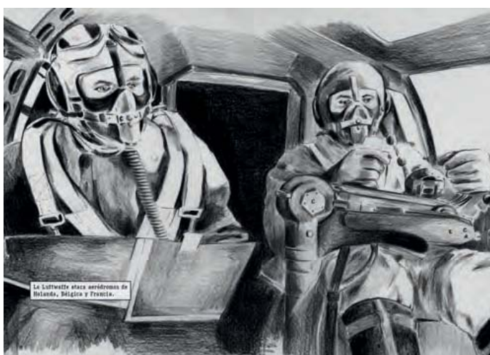
Pilotos de la Luftwaffe

Dibujante muy versátil, con experiencia en diversas áreas como la decoración, el diseño textil o la ilustración de libros juveniles, en esta ocasión ha optado por una estética oscura, basada en el empleo del carboncillo, muy apropiada para relatar la crudeza de la guerra, alejada de la luminosidad y alegría de muchos de sus trabajos. En este volumen, de excelente edición, con fondos en color sepia y separaciones en negro, las ilustraciones en blanco y negro encuentran un marco muy apropiado para relatar la crudeza de los hechos que se narran. ■