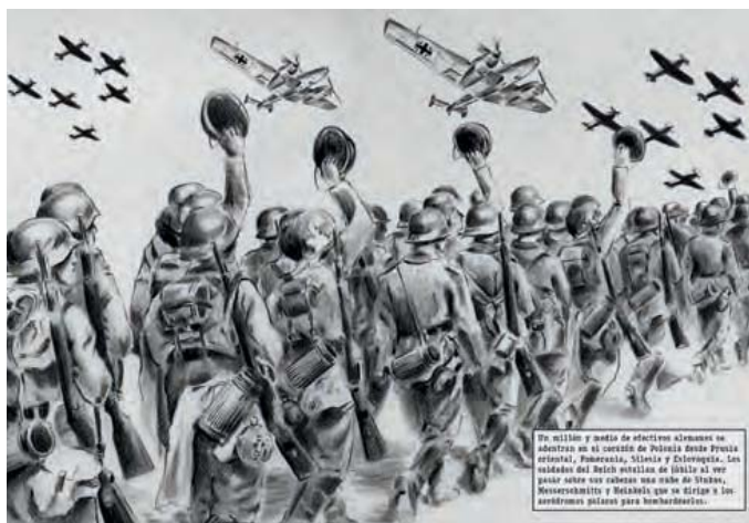
Invasión de Polonia