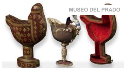
MUSEO DEL PRADO