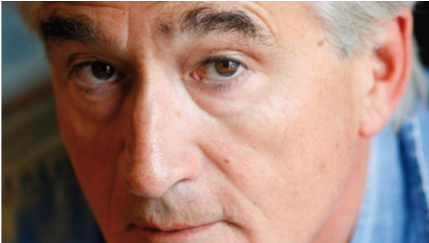
Antony Beevor, en una imagen promocional

El historiador cambia la pluma por el pincel en «Segunda Guerra Mundial. Una historia gráfica»