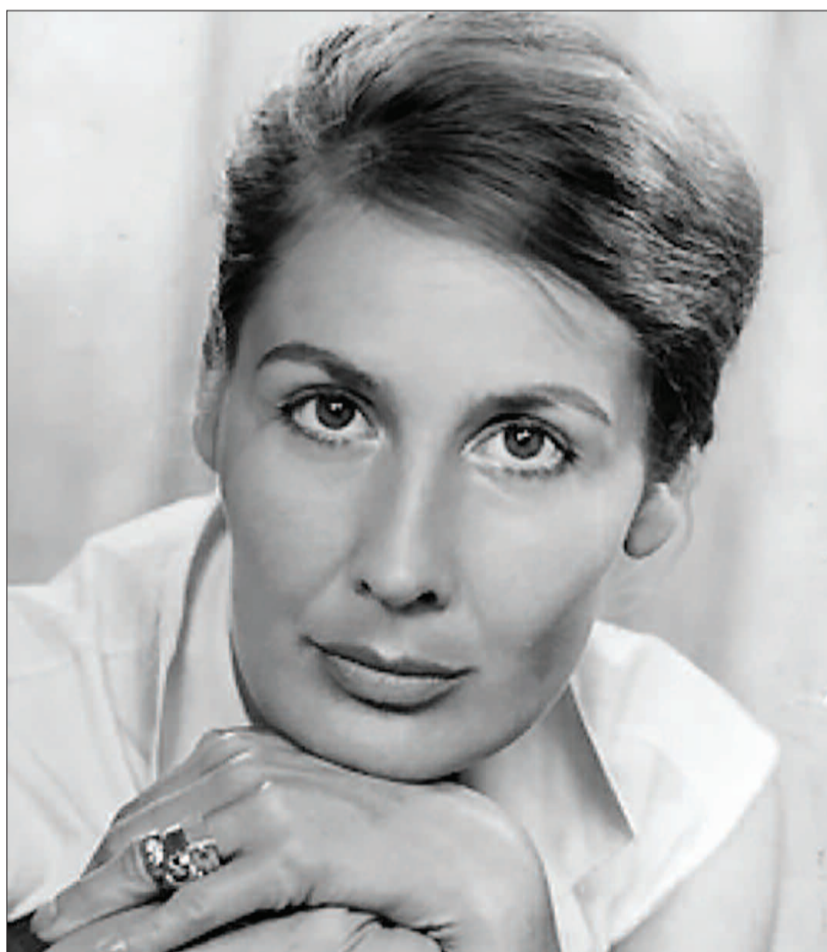
La escritora alemana Angelika Schrobsdorff. PERIFERICA Y ERRATA NATURAE

Si no han leído Tu no eres como otras madres no pasa nada; mejor, incluso. Así podrán ponerse en el pellejo de los atónitos lectores de Hombres , cuando aún supuraban en Alemania (y media Europa) las heridas de la posguerra. En ese territorio aniquilado, por donde deambulan los engreídos vencedores, Eveline busca sentirse reconocida, admirada, amada, pero nada de lo que se cruza en su camino sacia sus deseos: los hombres van y vienen, caen rendidos ante sus encantos, la idolatran, y ella los utiliza y los desprecia. De decepción en decepción, alejada de sus seres queridos, va asumiendo su propia educación en un mundo hostil, transmitiendo sus sentimientos en carne viva en un relato emocionante, sutil y estremecedor. Schrobsdorff construye a su mujer de sí misma y de las partes de otras muchas mujeres y consigue alumbrar la viva imagen de la desesperación en una novela extraordinaria.