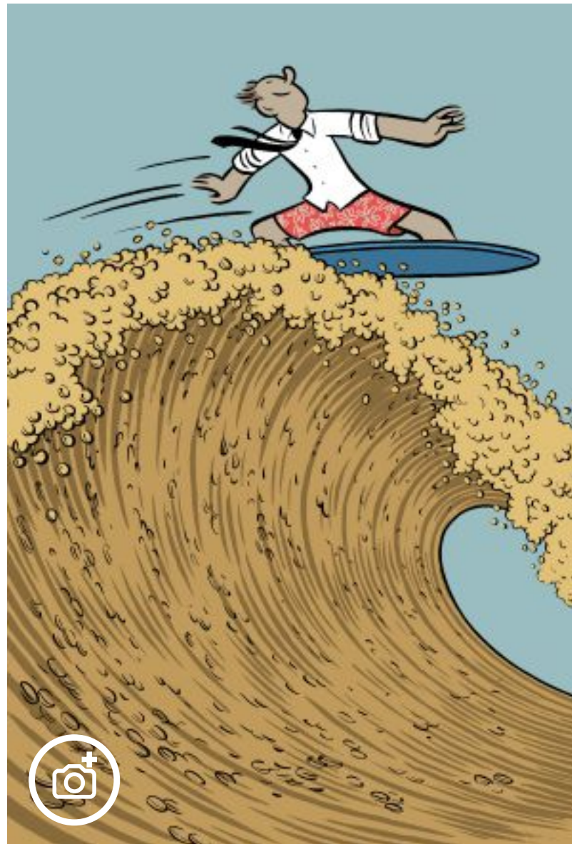
Ilustración de Max.

Últimamente tengo la viscosa sensación de que, desde la muerte (en camita y sin juicio) de Franco, todo ha transcurrido en un solo día, como en esas novelas circadianas que tanto gustan a los escritores modernistas y posmodernistas (piensen, por solo mencionar obras maestras, en Ulises , La señora Dalloway , Un día en la vida de