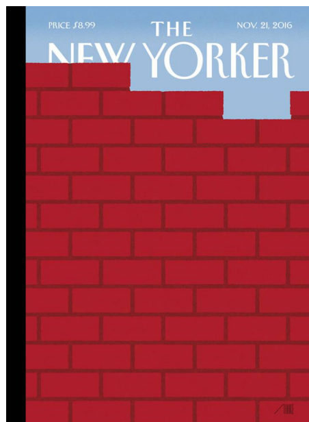
Portada del 'The New Yorker' del próximo 21 de noviembre, de Bob Staake.

También creo, como mi querido filósofo, que “la capacidad masiva de disparatar a coro es una prueba de salud democrática”. El problema es que tal peculiaridad, consustancial a la democracia, llevó a que un contumaz golpista (Múnich, 1923) que jamás ocultó su ideología consiguiera hacerse (30-1-1933) Reichskanzler , y que desde esa altísima magistratura procediera, por ejemplo, a eliminar la posibilidad de que otros disparataran (o no) a coro, a apiolar a judíos y diferentes y, en definitiva, a imponer una de las más terribles tiranías del siglo XX y provocar la mayor carnicería de todos los tiempos. No es que yo crea inevitable la