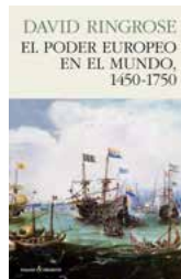
EL PODER EUROPEO EN EL MUNDO. 1450-1750

de conquistar políticamente la zona. Lo mismo pasó con otros territorios, por ejemplo con África y con Asia, donde otros países europeos, como Portugal, extendieron sus tentáculos para ampliar su horizonte comercial. En muchas de estas zonas apenas se dieron enfrentamientos bélicos, pues existía una auténtica apertura hacia los extranjeros, como pasó por ejemplo en muchos países de Asia. La conquista se llevó a cabo también en muchas ocasiones no por poderosos ejércitos sino como consecuencia de inteligentes alianzas y fruto de la diplomacia, como ocurrió con la conquista de México./A.T.