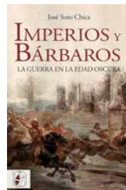
IMPERIOS Y BÁRBAROS. LA GUERRA EN LA EDAD OSCURA

Su autor, profesor de Hª Medieval, aborda el estudio de unos siglos que "transformaron de forma definitiva el antiguo mundo", que se organizaba en torno a tres grandes imperios: el romano, el persa y el chino. A partir de entonces, nada fue igual. Soto Chica, de manera especial, señala la nueva manera de concebir la guerra y la composición de los ejércitos, además de describir de manera minuciosa las batallas más decisivas./A.T.