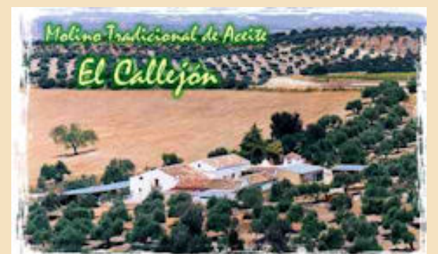
Molino de aceite