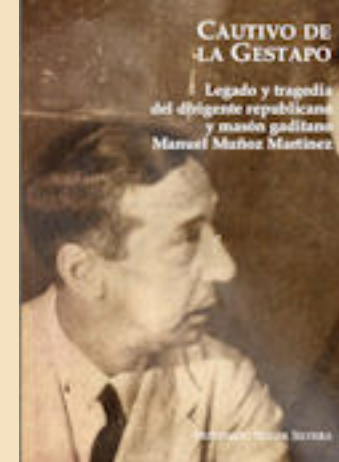
Cautivo de la Gestapo