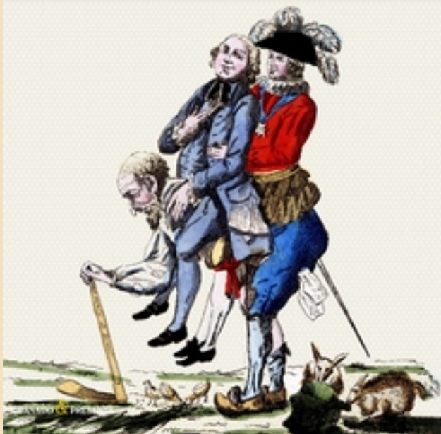
Cubierta del libro.

GONZALO PONTÓN LA LUCHA POR LA DESIGUALDAD UNA HISTORIA DEL MUNDO OCCIDENTAL EN EL SIGLO XVIII PRÓLOGO DE JOSEP FONTANA