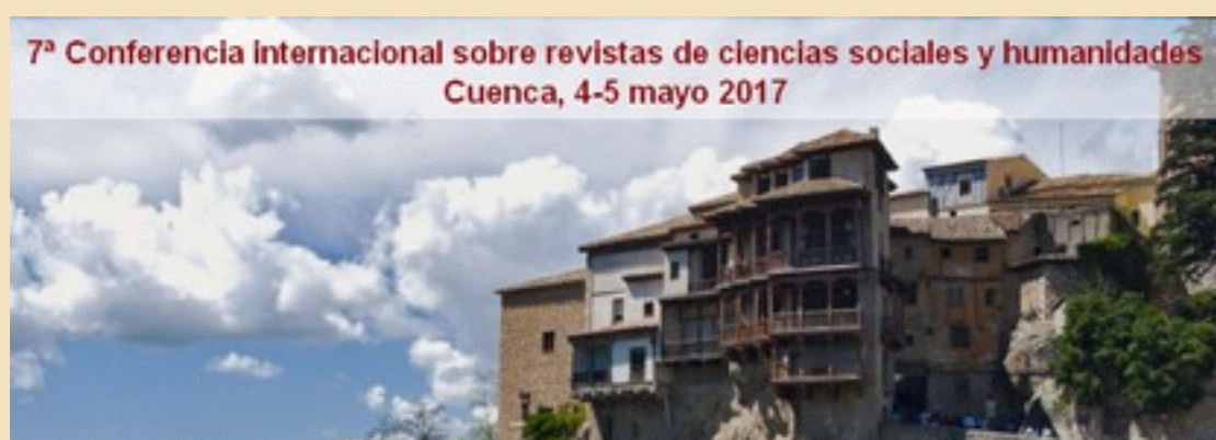
Captura de la web de presentación del evento.