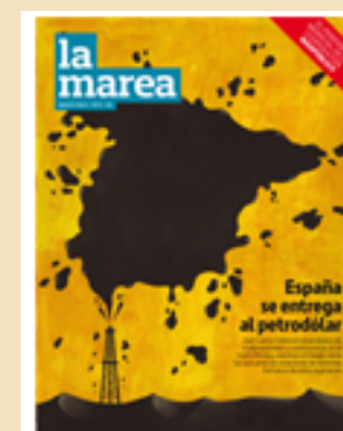
Otro periodismo es posible