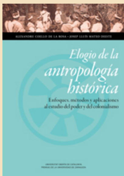
Cubierta del libro.