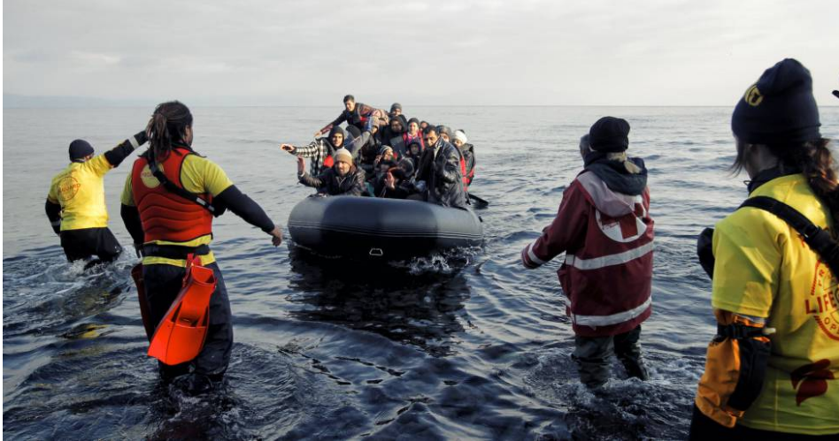
Arribada de refugiats per mar a l'illa grega de Lesbos, a finals de gener d'enguany.

Quadern. La imatge que més bé expressa el segle XVIII és, per a Gonzalo Pontón, el quadre L'al·legoria de la pobresa , d'Adriaen van de Venne, no?