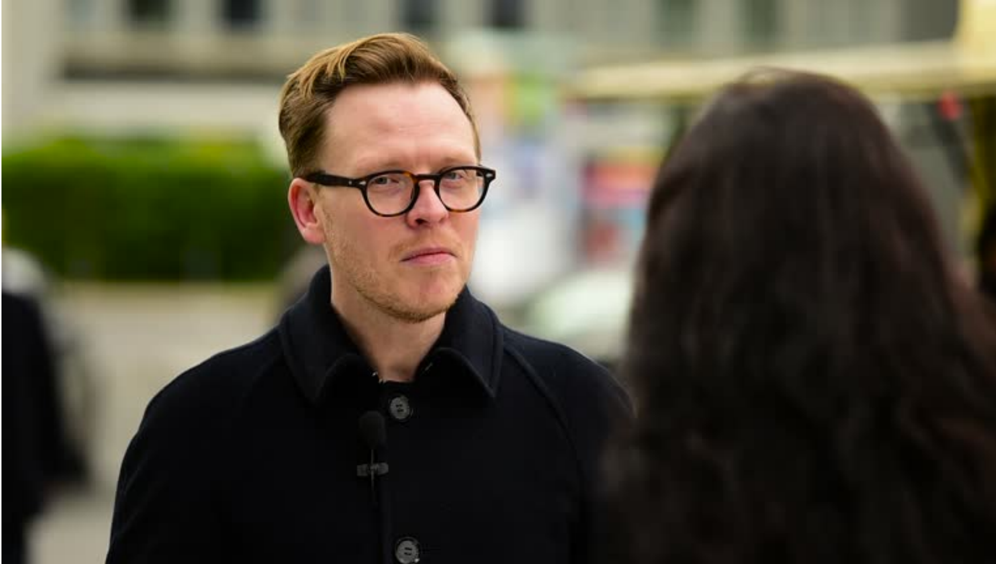
( http://www.nuvol.com/wp-content/uploads/2016/03/6aad0ef7-cdda-4f30-98b1-eab3245529b2-5.jpg )