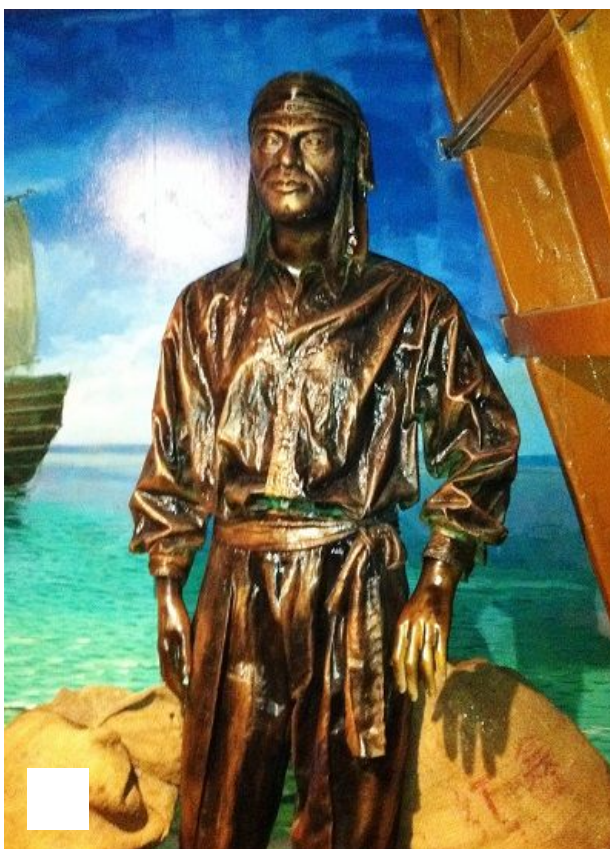
Estatua de Enrique de Malaca

Las portadas se ceban con la apuesta fallida de Theresa May