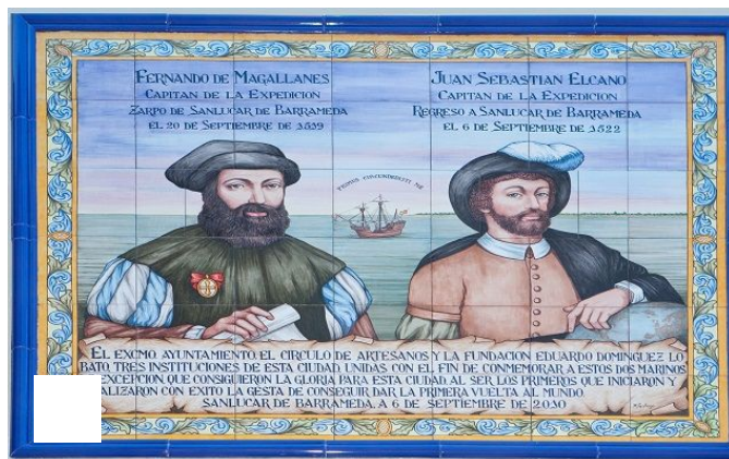
Azulejo conmemorativo de la expedición de Magallanes y Elcano que circunnavegó el planeta en Sanlúcar de Barrameda

Buscas ofertas de SUVs? Yahoo! Sponsored