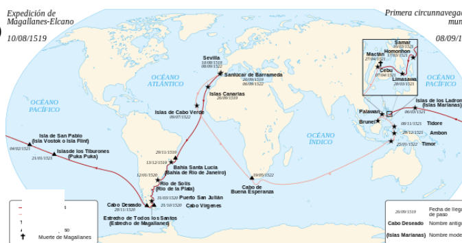
Podría haber sido un esclavo el primero en circunnavegar alrededor del planeta (imagen vía Wikimedia commons)

Se conoció como 'Armada de las Molucas' a la flota española que partió desde Sanlúcar de Barrameda el 20 de septiembre de 1519 y que tenía como misión encontrar un camino alternativo – por la ruta de Occidente- hacia las preciadas 'isla de las Especies' (en realidad se llamaban islas Molucas ) y que se encontraban en el archipiélago de Indonesia.