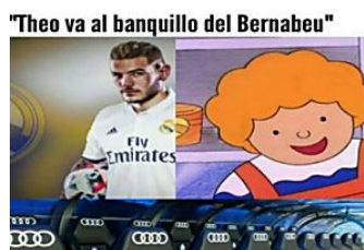
"Theo va al banquillo del Bernabeu" El 'meme' deportivo del día Sport