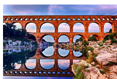
Hoy damos los buenos días desde... VIAJAR