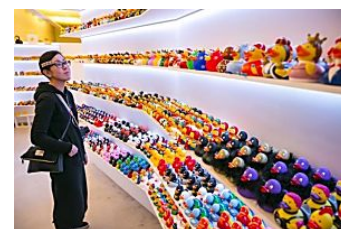
5 tiendas donde encontrar regalos que no te devolverán On Barcelona - Qué hacer en Barcelona