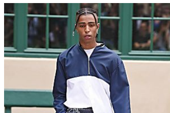
Andrea Crews Elle.es