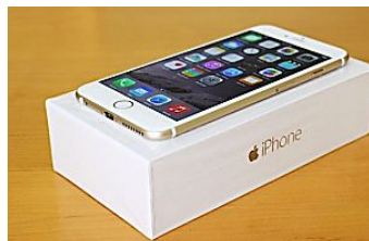
¡iPhone sobrantes de 619€ vendidos por menos de 58€! Revista Del Consumidor Online