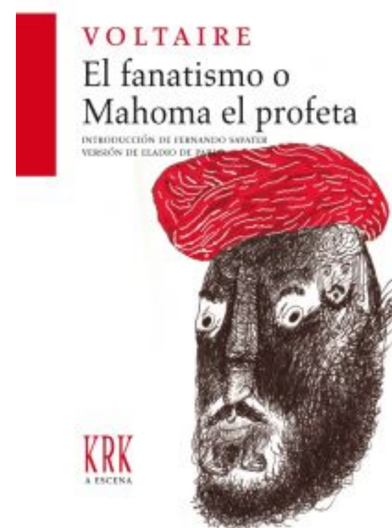
El fanatismo según Voltaire Demetrio Castro