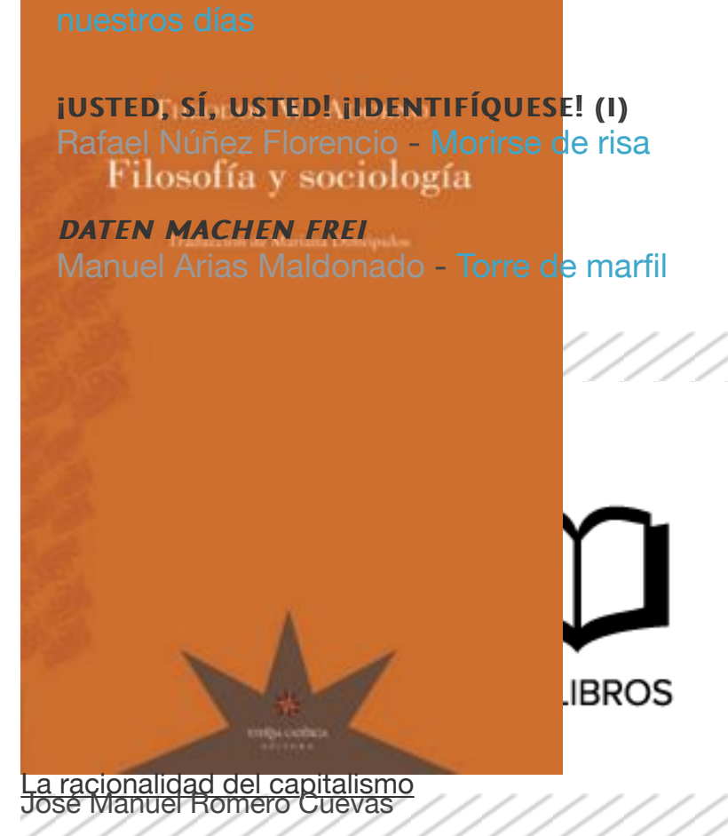
La racionalidad del capitalismo José Manuel Romero Cuevas

La fase moderada de la política interna soviética a mediados de los años veinte coincidió con el «Segundo Período», tal y como fue bautizado, de la política de la Comintern, que reconoció que las economías europeas habían conseguido estabilizarse y que las perspectivas para una revolución inmediata se habían desvanecido. En 1928, sin embargo, después de que Stalin hubiera impuesto nuevas y drásticas políticas revolucionarias dentro de la Unión Soviética, esto dio paso al “Tercer Período” de la Comintern, que comenzó con la que fue probablemente la única profecía comunista acertada jamás realizada: que la recuperación de las economías europeas era sólo temporal, con una nueva e importante crisis acechando en el horizonte. Esto abriría el camino para el rápido avance de la revolución a una amplia escala, y en muchos países. La primera consecuencia de esta política precipitada, sin embargo, fue acentuar la división interna de la República de Weimar en Alemania y preparar el camino para el triunfo de Hitler. Este desastre, aunque pronto se vería que adoptaría unas proporciones verdaderamente históricas y mundiales, causó en principio una escasa impresión en Stalin, dejando de manifiesto que estaba lejos de ser el maestro pragmático de la táctica revolucionaria que afirmaba ser. Aun después de que los comunistas de varios países reclamaran un cambio de política en 1934 –la cooperación con otras fuerzas izquierdistas en su oposición al fascismo–, Stalin se negó.