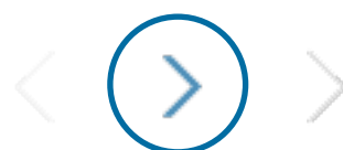
Foto 1 de 25

25 librereros de 10 ciudades españolas nos traen sus recomendaciones a través de Librotea