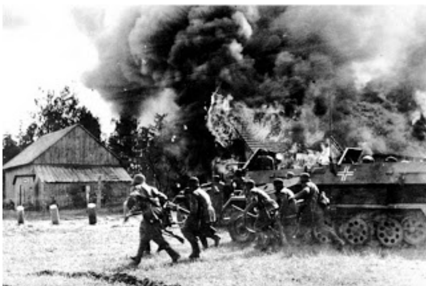
Tropes alemanyes durant la invasió de la URSS