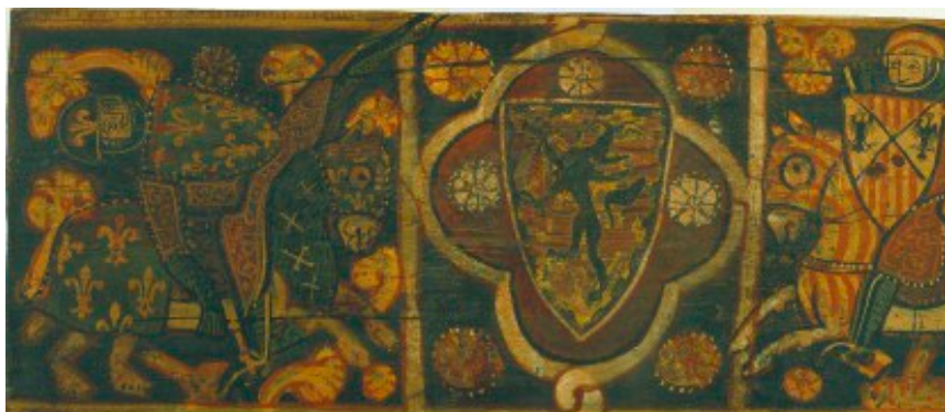
Taula d'enteixinat amb un cavaller de la casa d'Anjou abatut per un cavaller de la casa d'Aragó i les armes en aspa de Catalunya-Aragó i les de Suàvia de Frederic de Sicília.

oblidar tampoc les relacions i sobretot les tensions entre diferents religions , especialment pel que fa a les comunitats jueves i musulmanes tant dels territoris italians, com dels territoris hispànics de la Corona d'Aragó.