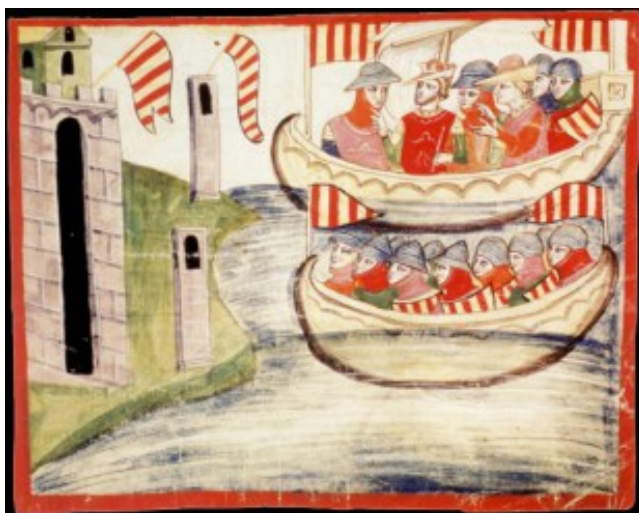
Miniatura que mostra el desembarcament del rei Pere el Gran a Trapani (Sicília) l'any 1282, responent a la crida dels revoltats sicilians, que li oferiren la corona. Font: Biblioteca Apostòlica Vaticana, s. XIV

El llibre està dividit en tres parts seguint un criteri cronològic , corresponent la primera a allò que l'autor anomena "Els reptes del segle XIII" , però que realment fa retrocedir fins als orígens del regne normand de Sicília, els seus hereus alemanys de la casa Hohenstaufen i la conflictiva relació entre aquests i el Papat ,