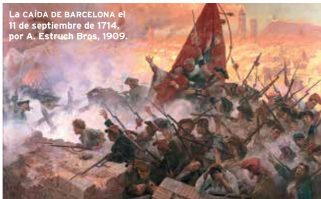
La CAÍDA DE BARCELONA el 11 de septiembre de 1714, por A. Estruch Bros, 1909.