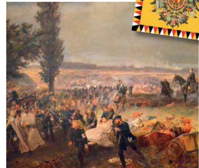
La derrota austriaca frente a los prusianos en la BATALLA DE SADOWA (1866), en una obra de Georg Bleibtreu, Museo Histórico Alemán.

hecho, uno de los regimientos más condecorados del ejército imperial a la altura de 1918 estaba conformado por bosnios islámicos—. Aunque poco adaptado a la tecnología y las estrategias militares contemporáneas, Bassett concluye