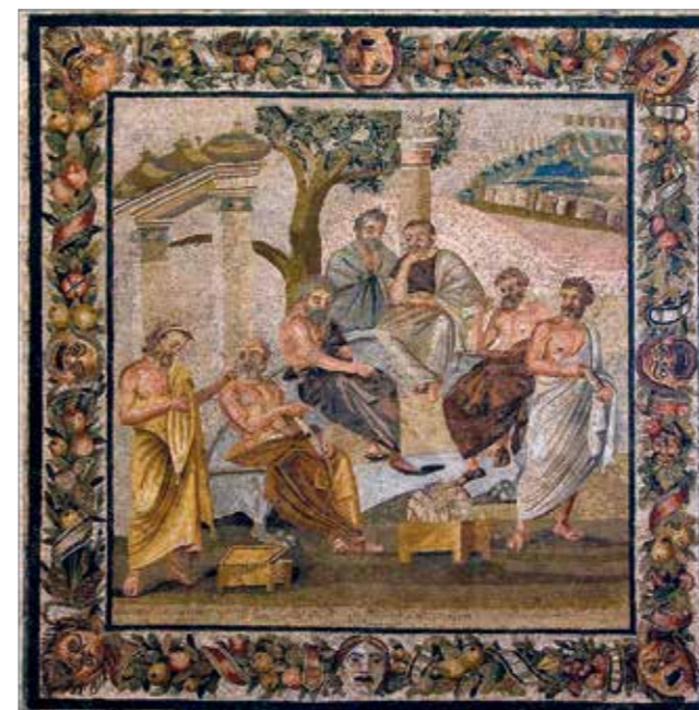
MOSAICO de la Academia de Platón hallado en Pompeya, siglo I a.C., Museo Arqueológico de Nápoles. Abajo, ANFORA ÁTICA, siglo IV a.C., MET.

Filipo II y Alejandro III de Macedonia hasta el Panheleño de Adriano, el consejo de todas las ciudades de origen griego que impulsó el emperador filoheleno.