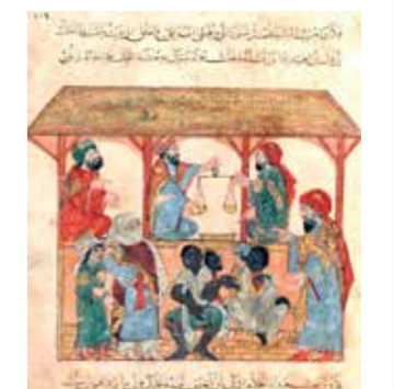
MERCADO DE ESCLAVOS EN YEMEN, en un manuscrito del siglo XIII.

en la legislación visigoda, o en las Siete partidas de Alfonso X el Sabio, la extensión del fenómeno en los dominios de la Corona de Aragón y la actividad de los mercados de esclavos en Sevilla y otras ciudades castellanas y de Portugal, en la segunda mitad del siglo XV, de manera que cuando ambos reinos colonicen América se limitarán a utilizar una institución que conocían perfectamente porque nunca había dejado de existir. ■ ARTURO ARNALTE