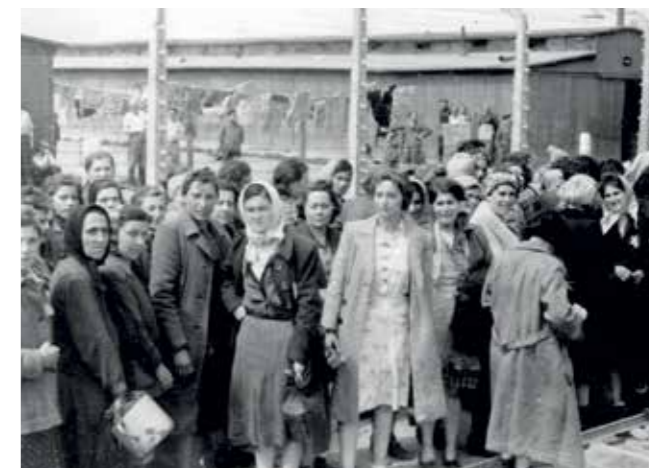
Un grupo de mujeres en el campo de AUSCHWITZ-BIRKENAU.

incertidumbre a través de preguntas que le han planteado los jóvenes en las conferencias que ha impartido en todo el mundo. Una obra divulgativa en la que la autora reivindica el rol de los testigos presenciales de esas atrocidades y la importancia de que sus experiencias sobrevivan al paso del tiempo, para que cuando ya no estén sus historias no queden sepultadas.