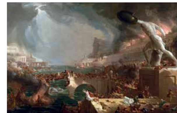
La obra DESTRUCCIÓN, de la serie El curso del imperio , de Thomas Cole, 1836, remite al saqueo y declive de Roma.

Esta obra evidencia cómo una civilización se puede condenar no solo por errores ideológicos, sino también por sucesos que escapan a su poder. Por tanto, una de sus mejores virtudes es que ofrece una mirada alternativa a la historia teniendo presentes consideraciones solo manejadas por especialistas. ■ MIGUEL ÁNGEL NOVILLO