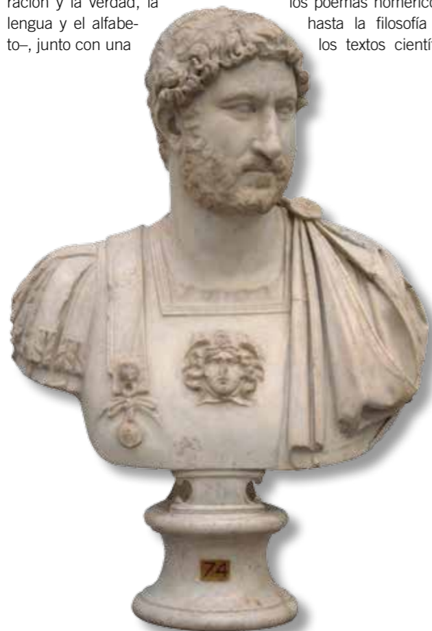
Busto del emperador romano ADRIANO, Museos Vaticanos. Más arriba, medallón de ALEJANDRO MAGNO como el dios Helios, Museo del Louvre.