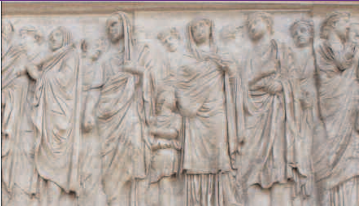
Detalle del Ara Pacis, mandada erigir por Augusto

Un trabajo encomiable que ha dado lugar a uno de los libros más bellos que se han publicado en esta región últimamente. Producido desde el amor a la naturaleza y el afán por reivindicar una de las figuras fundamentales de la defensa del medio ambiente que han vivido en nuestro país, merece la pena tenerlo en casa para recordar lo mucho que es preciso luchar para defender nuestro entorno natural, además de disfrutar de buena literatura y mejor arte.